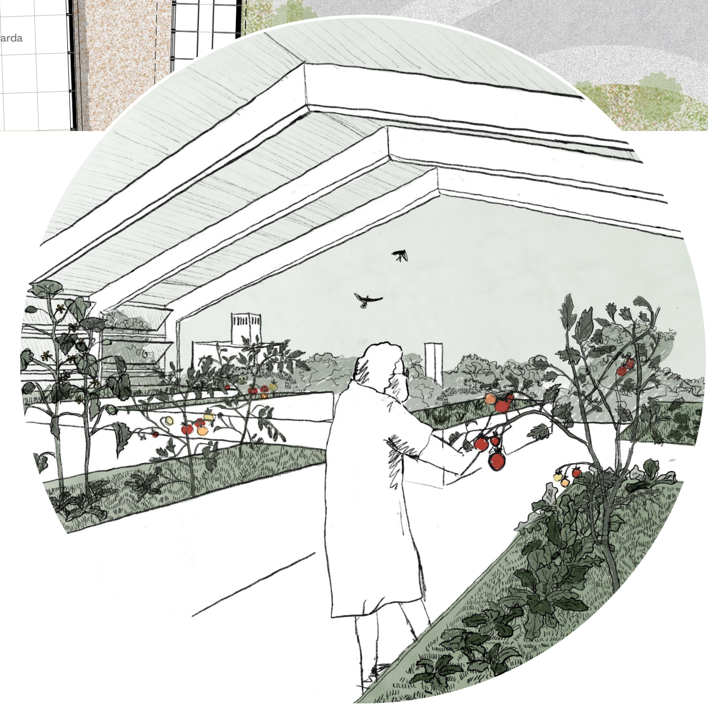
Üvegház a Növények Háza tetőzintjén