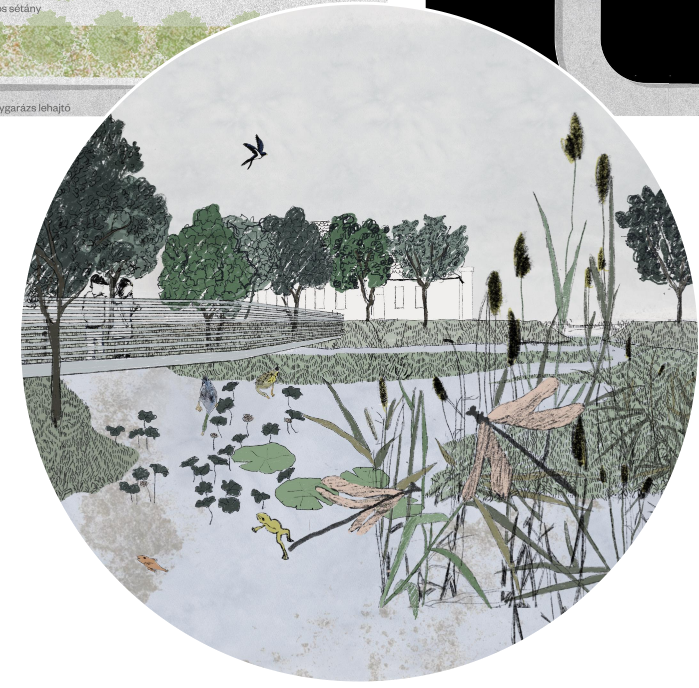
Tandevény az Ördög-árok vizes élőhelyén*