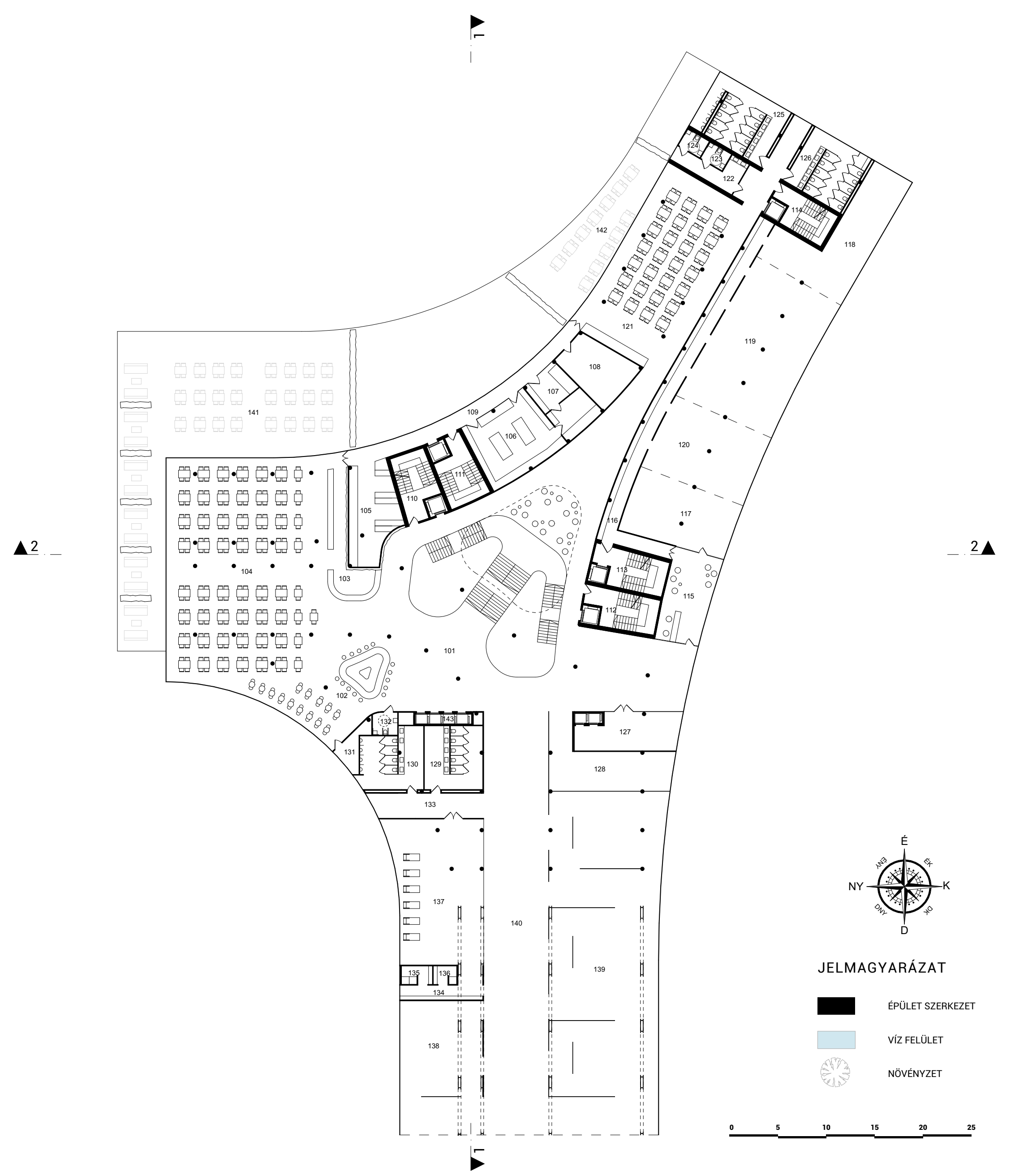
SZÁLLODA - 1. EMELETI ALAPRAJZ M 1:350