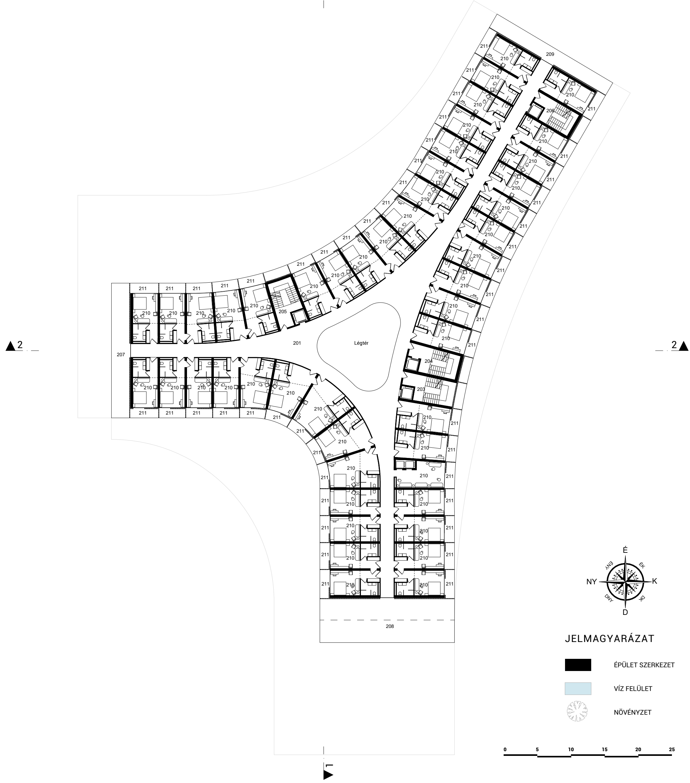
SZÁLLODA - ÁLTALÁNOS SZINTI ALAPRAJZ M 1:350