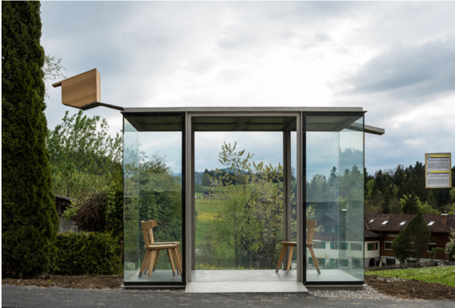
Smiljan Radčić's BUS-STOP design